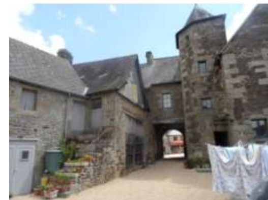
Vue d'ensemble de la cour.