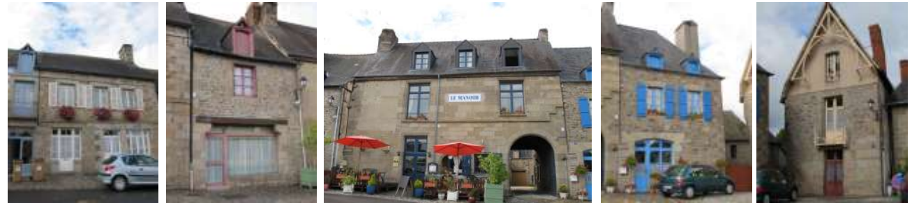
Epannelage et insertion dans la rue

CLASSEMENT: patrimoine architectural exceptionnel, méritant une protection au titre de la législation sur les Monuments Historiques.