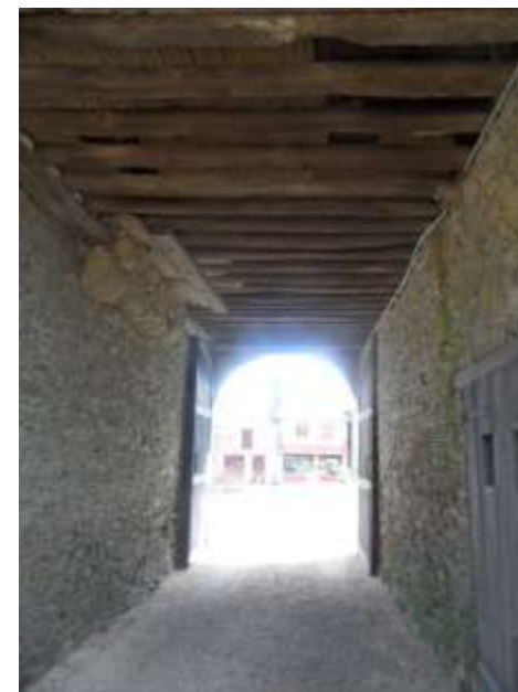
Le passage charretier