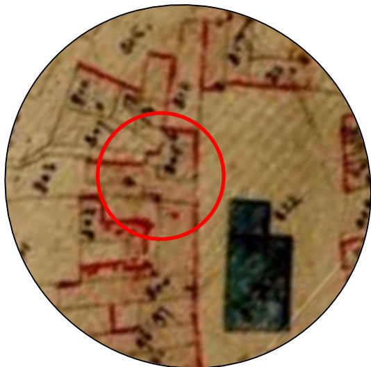
Cadastré de 1826