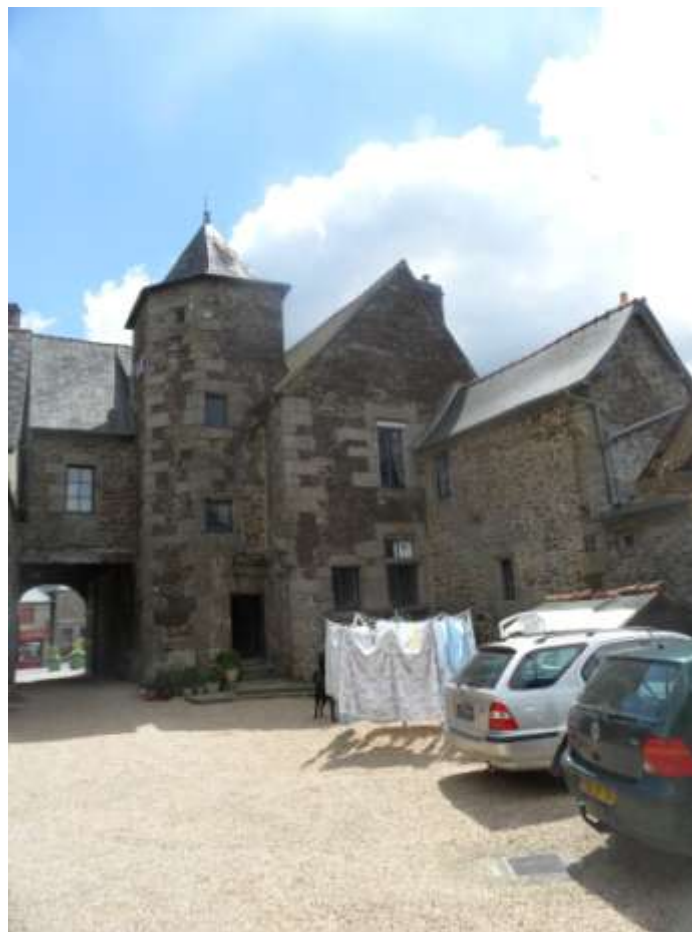
Vue de l'arrière, sur cour, avec la tour d'escalier du XVIII e s. qui articule les deux ailes. Sa hauteur permet de supposer qu'elle desservait un étage sous combles habitable.